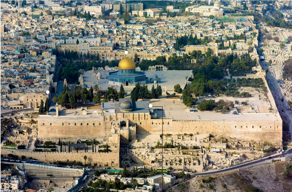
▪ Kubbetü's Sahra

Kubbetü's Sahra ve Kible Mescidi'ni de kapsayan 144 dönümlük bir alandır.